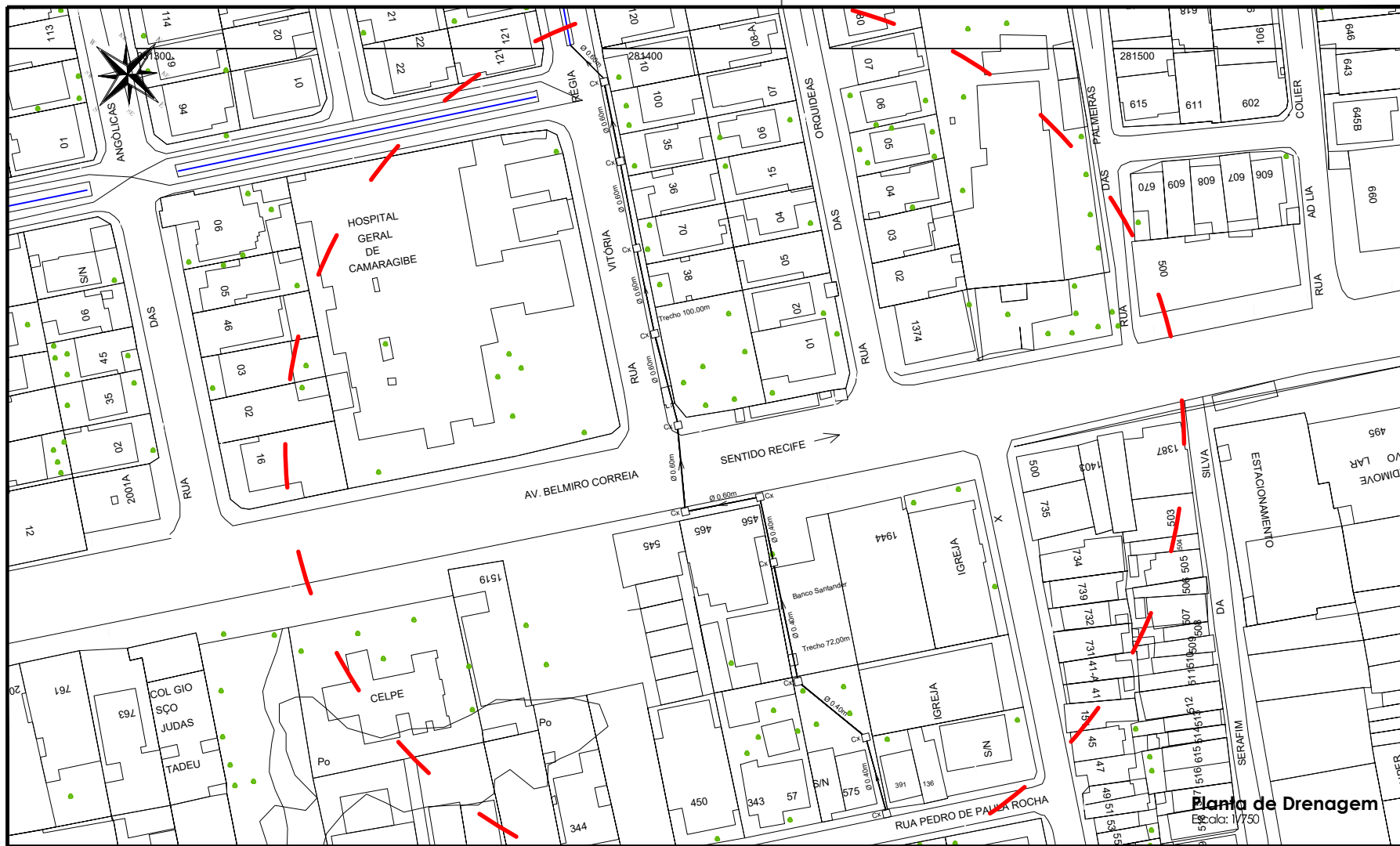
Plano de Drenagem Escala: 1/750