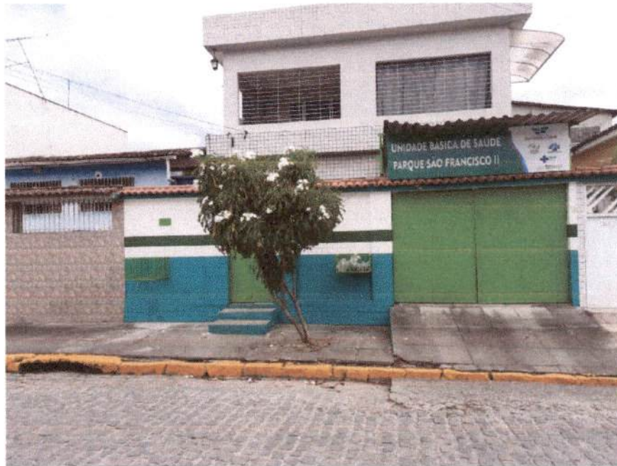
FOTO DO IMÓVEL